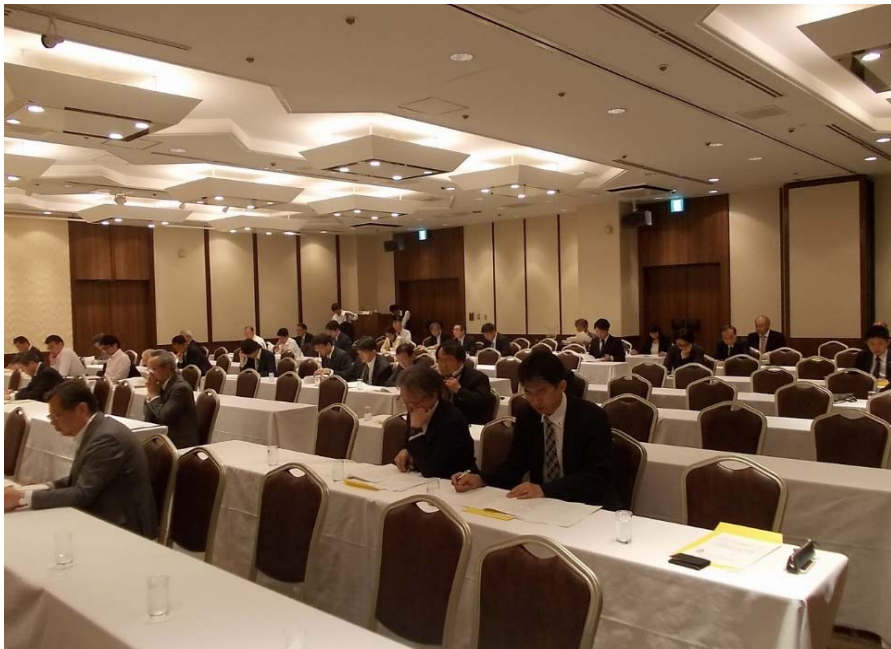
参加人数46名、委任状109通で 総会は成立