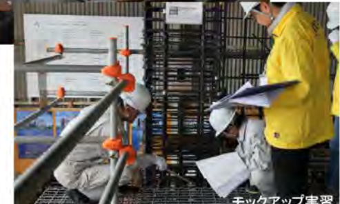
モックアップ実習