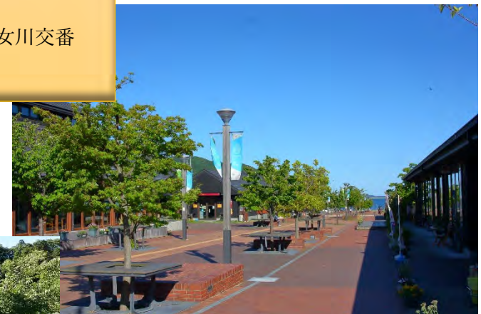
シーパルピア女川